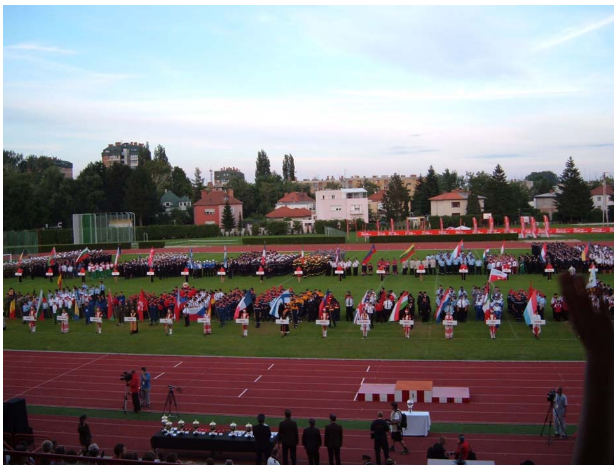
Åpnings seremoni – ca 2800 deltakere fra hele Europa.